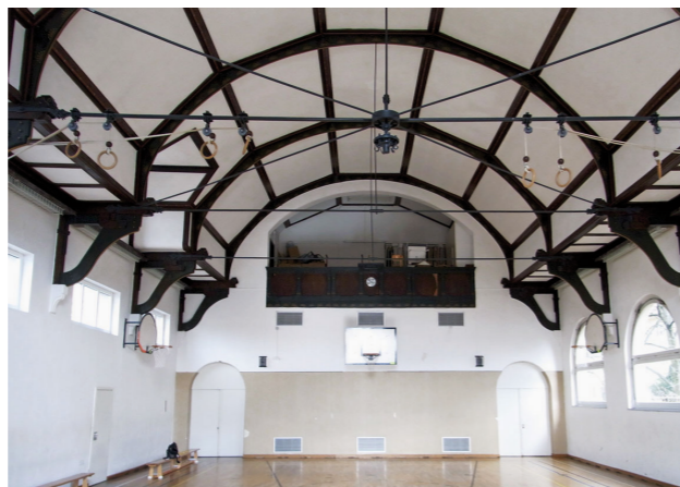
Turnraum der Heiligkreuz-Mittelschule nach der Sanierung zur Nutzung als Pausenraum

Die Einführung der eVergabe in der Stadtverwaltung Coburg ist im 4. Quartal 2017 vorgesehen. Die eVergabe soll zunächst bei ausgesuchten Vergabeverfahren angewendet werden, um dann sukzessive auf alle förmlichen Vergabeverfahren der Stadt Coburg ausgeweitet zu werden und letztlich zum 08.01.2018 einen konstant-stabilen Betrieb gewährleisten können.