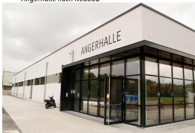
Angerhalle nach Neubau